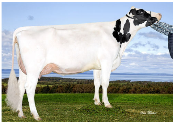
IHG MARDI SENS 9017