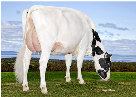
IHG MARDI SENS 9017